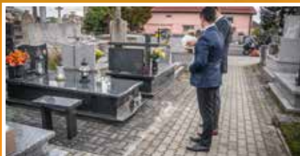
Pamiętajmy o tych, którzy odeszli - s.8