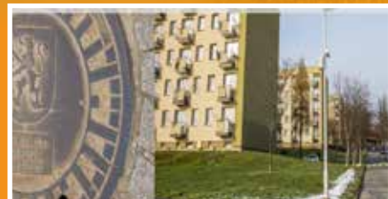
18 milionów zł trafi do Gorlic - s. 7